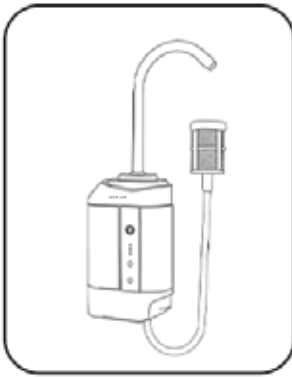
كيفية الحصول على الماء