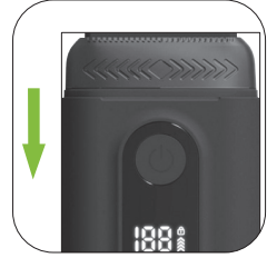
٣. إعادة تجميع رؤوس الشفرات إلى الجسم

إذا كنت بحاجة إلى إزالة الشفرات وغسلها، يُنصح بالاستعانة بفني محترف لتشغيلها والتأكد من عدم تغير وضع جميع الشفرات وشبكاتها. أعد تركيبها في أماكنها الأصلية. قد يؤدي عدم القيام بذلك إلى زيادة الضوضاء، وإضعاف فعالية الحلاقة، وعدم انتظام التشغيل.