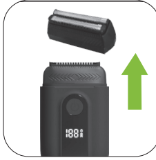
٢. فصل جسم ماكينة الحلاقة