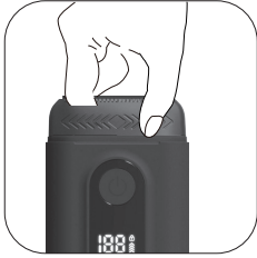
١. السحب لأعلى