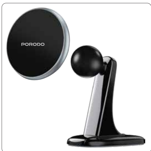
قم بإدخال المنطقة المغناطيسية على الكرة.