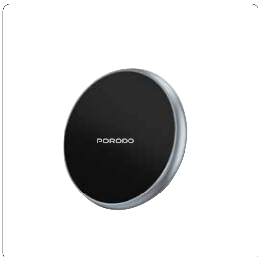
قم بتدوير الصامولة وفكها.