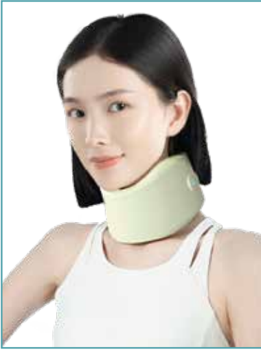
عرض توضيحي لطريقة الارتداء