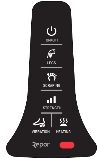
لوحة التحكم باللمس