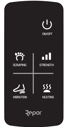
لوحة التحكم باللمس